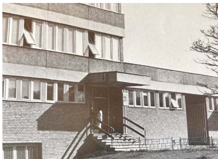
A korabeli tudósítások szerint a gödöllői SZTK-épület megépítése fél évszázada 24 millió forintba került

Hat évvel azt követően, hogy Gödöllő várossá vált, megépült és átadták a Gödöllői Egyesített Egészségügyi Intézet (köznyelven: