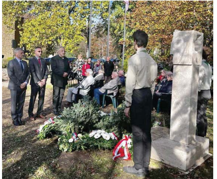
A Szövetség Gödöllőért önkormányzati képviselői elhelyezik az emlékezés virágait a tavaly áprilisban a 802. számú Szent Korona Cserkészcsapat birtokába került Bezsilla-villa épületének kertjében felállított 56-os emlékoszlopnál

Október 23-án – ahogy az elmúlt években rendszeresen – idén is a délutáni órákban zajlott le a városi megemlékezés-sorozat az 1956-os forradalom és szabadságharc 66. évfordulója alkalmából. Elsőként a gödöllői nemzetőrség egykori épületének (Bezsilla-villa) Szabadság út 9. szám alatt lévő kertjében az elmúlt évben felállított emlékműnél koszorúztak magánszemélyek, illetve a különböző helyi intézmények és szervezetek, valamint politikai pártok képviselői.