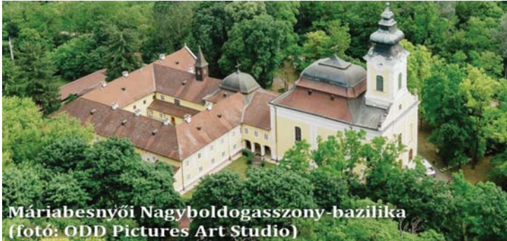
Máriabesnyői Nagyboldogasszony-bazilika

Újranyitják kolostorukat a kapucinusok Máriabesnyőn